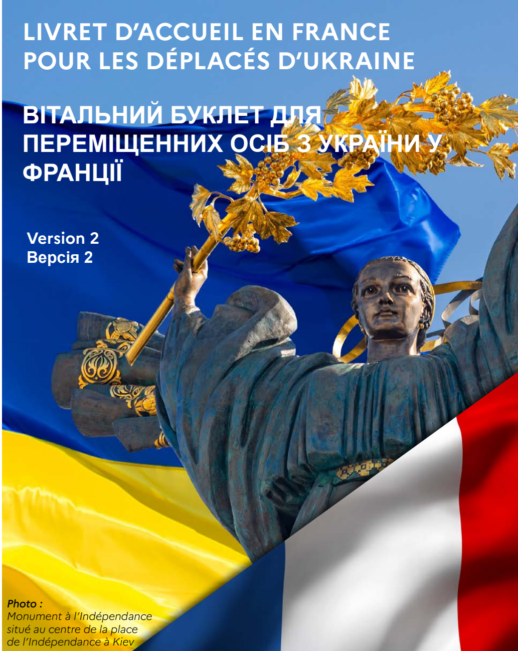
Photo : Monument à l'Indépendance situé au centre de la place de l'Indépendance à Kiev