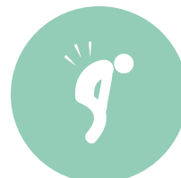
Douleurs et faiblesses musculaires